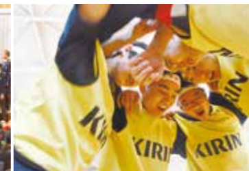
輝跡祭(ザベリオスポーツカップ)