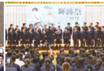
輝跡祭(校内合唱コンクール)