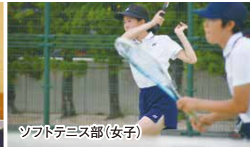
ソフトテニス部(女子)