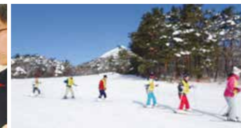
スキー合同合宿(小5/6年・1年)