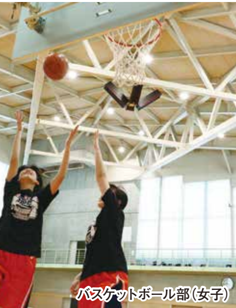
バスケットボール部(女子)