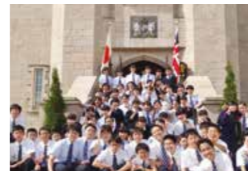
ブリティッシュヒルズ研修(2年)

音楽祭やスポーツカップ、総合学習の発表など、生徒た ちの日頃のさまざまな活動の成果を披露する機会とな ります。